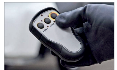
Control remoto (Opcional)