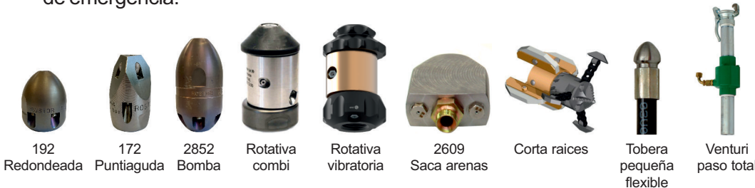
192 Redondeada 172 Puntiguda 2852 Bomba Rotativa combi Rotativa vibratoria 2609 Saca arenas Corta raíces Tobera pequeña flexible Venturi paso total