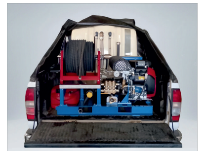
Equipo para pick-up