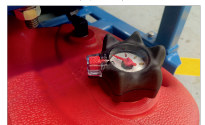
Depósito gasolina con indicador de nivel