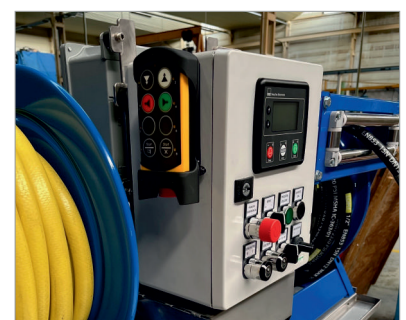
Radio control remoto opcional